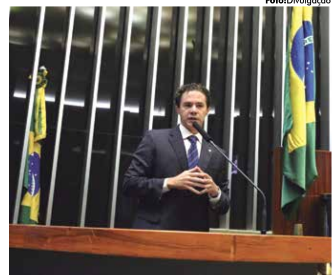
PEC é de autoria do deputado paraibano Veneziano Vital do Rêgo

A PEC será agora analisada por uma comissão especial, antes de ser votada em dois turnos pelo Plenário.