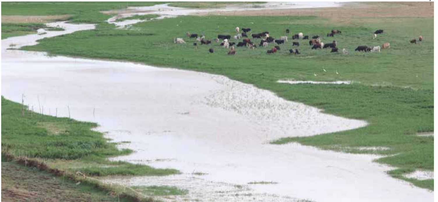
Águas da Transposição do Rio São Francisco começaram a chegar esta semana ao Açude Boqueirão, que abastece Campina Grande e mais 17 municípios

Também foram alterados os dias e horários do abastecimento em Pocinhos, Queimadas, Barra de Santana, Caturité e nas cidades que compõem o Sistema Adutor do Cariri e do Brejo. Nessas cidades, a população pode buscar mais informações diretamente nos escritórios locais da Cagepa.