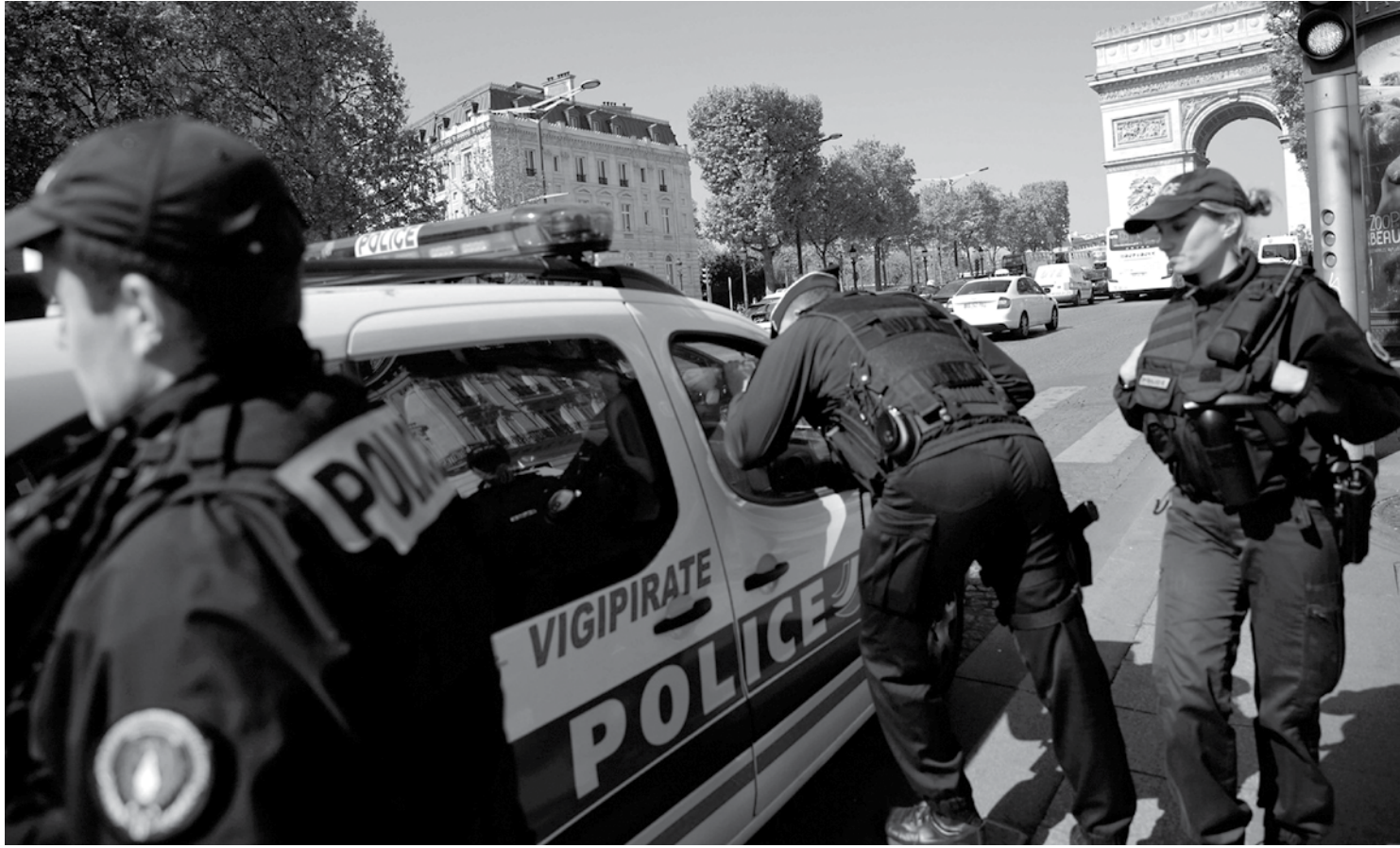
Policiais reforçam a segurança na Avenida Champs Élysées, em Paris, após atentado que deixou um policial morto e dois feridos na última quinta-feira

Campanhas e a publicação de pesquisas de intenções de voto são banidas da meia noite desta sexta-feira até o fechamento das mesas de voto. O primeiro turno de domingo será seguido por uma disputa de segundo turno em 7 de maio entre os dois candi-