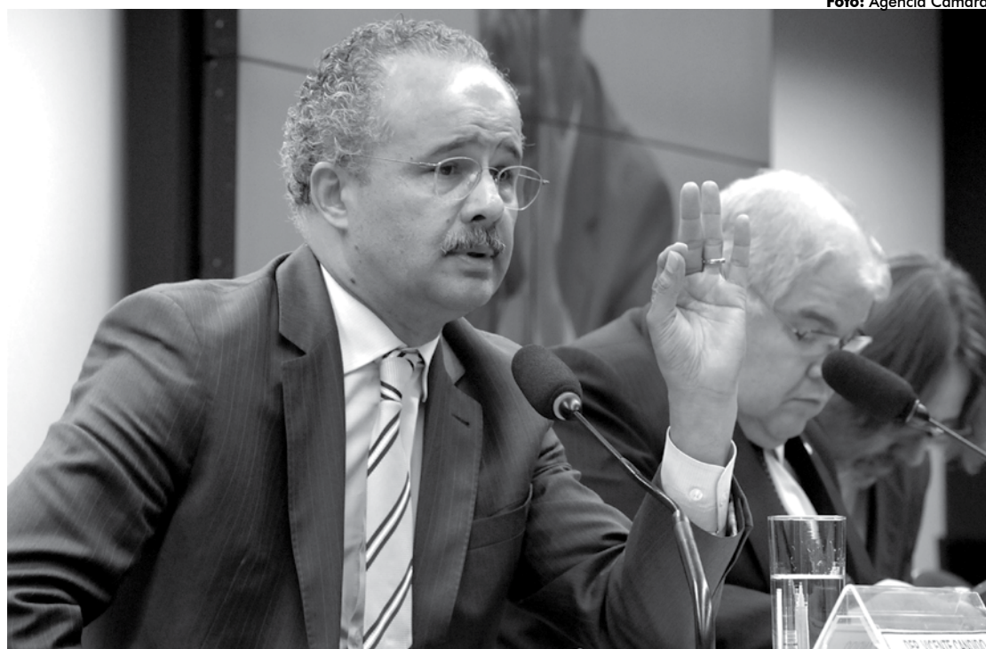
Deputado Vicente Candido (PT-SP) vai apresentar o relatório para debate e votação nas próximas quarta e quinta-feira

"Esse projeto é um novo marco regulatório que facilita as assinaturas por meio eletrônico e amplia os espaços em que a população poderá pedir para que o Congresso Nacional realize referendo ou plebiscito sobre os mais variados temas. A população também poderá pedir