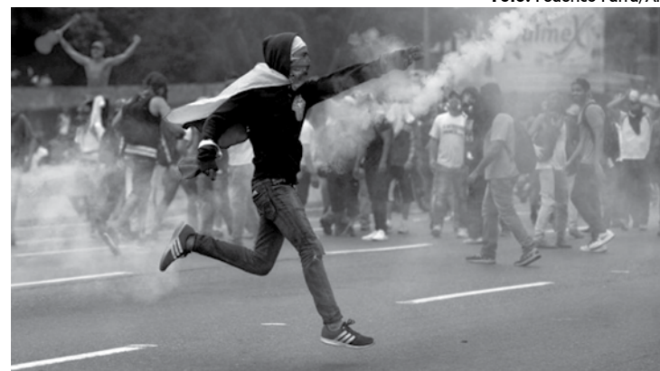
Manifestantes se chocam com a polícia durante protesto na Venezuela