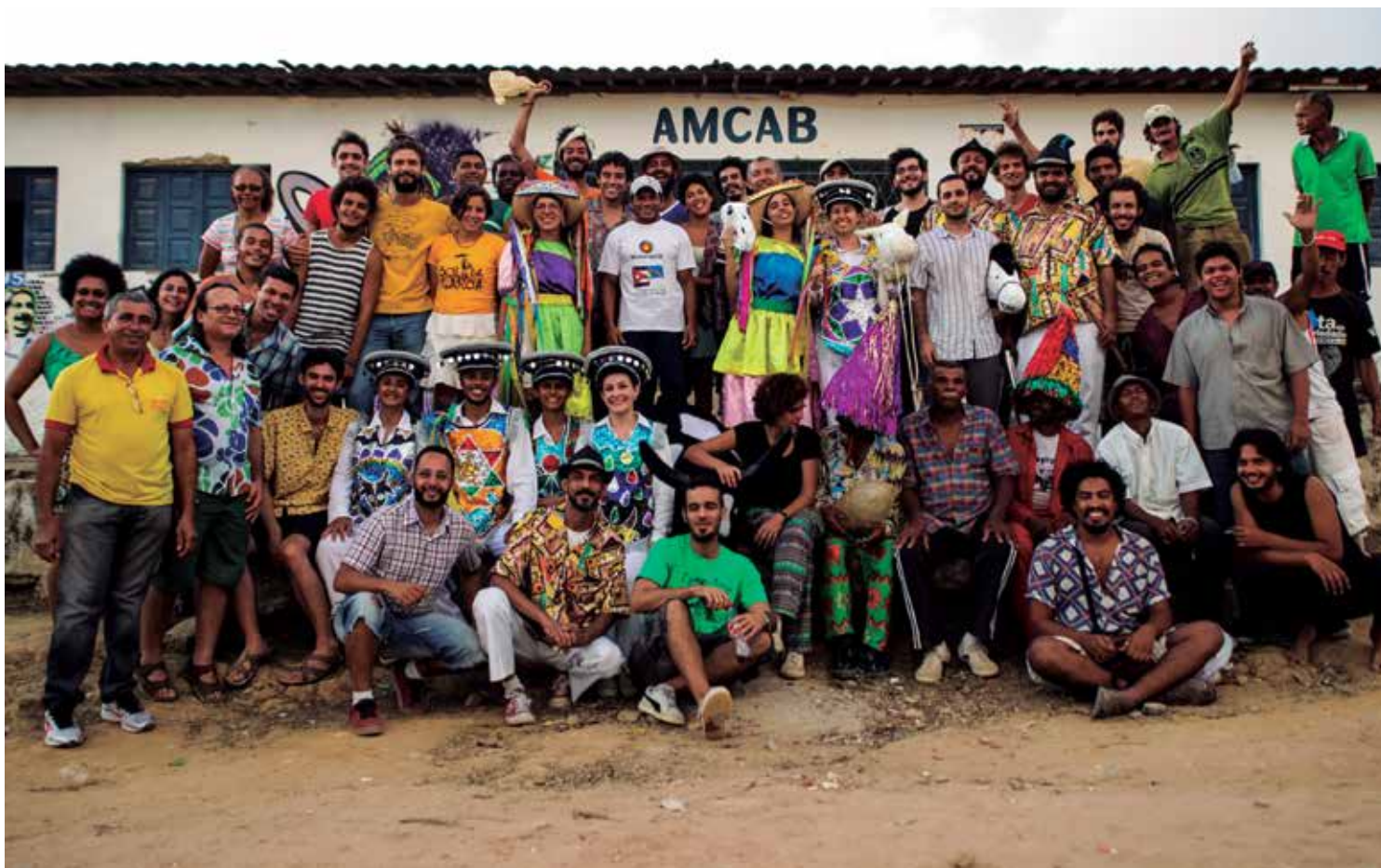
O Coletivo Maracastelo estimula de forma lúdica o debate e a reflexão acerca da cultura afro-brasileira, promovendo um aprendizado sobre a diversidade

“Representação social que se realizava na década de 1980, durante o corte da cana-de-açúcar, a Sambada do Cavalo Marinho ia até o amanhecer. No entanto, por questões mercadológicas, atualmente o evento cos-