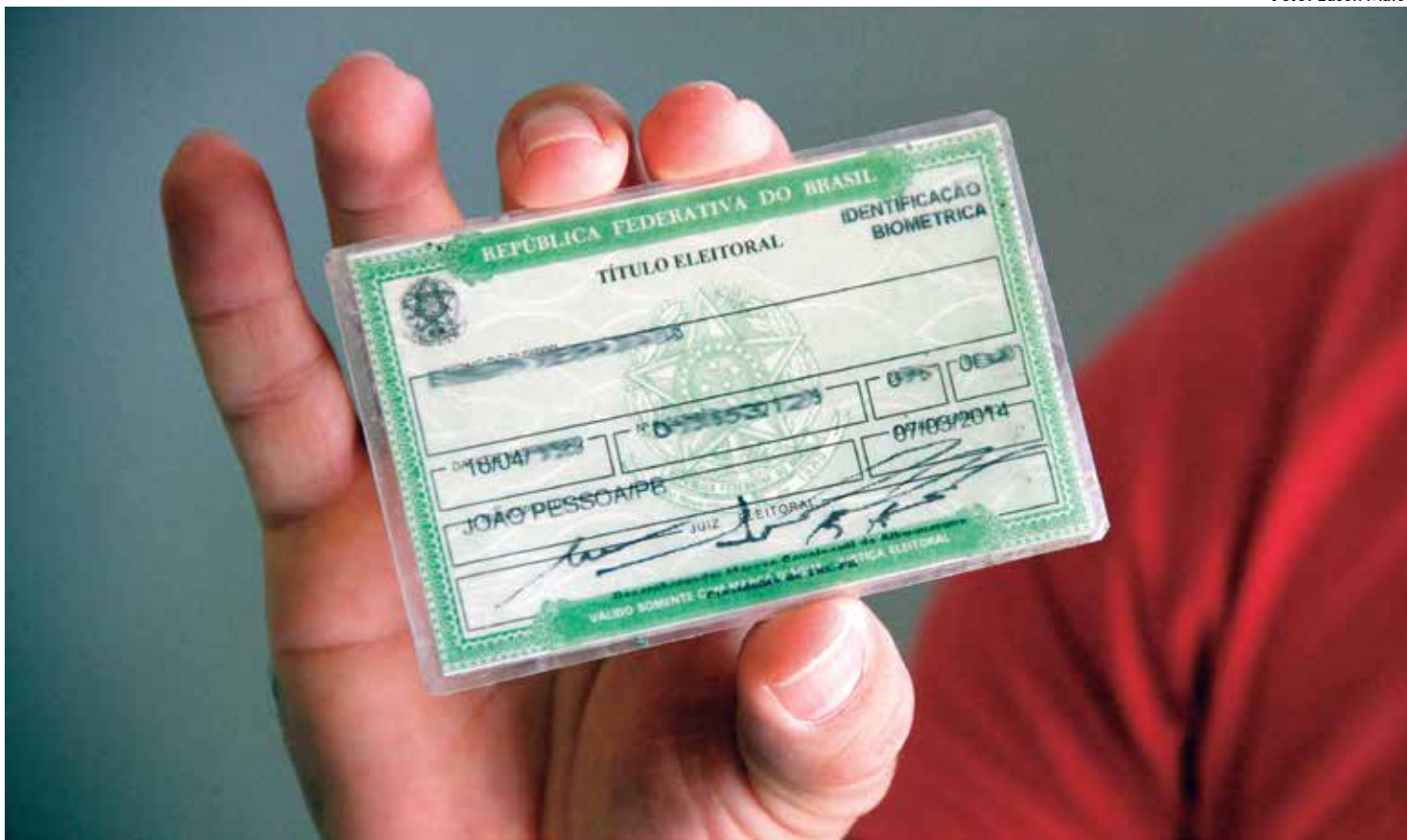
A legislação considera cada turno de votação um pleito em separado para efeito de cancelamento de título de eleitor de forma automática

A legislação considera cada turno de votação um pleito em separado para efeito de cancelamento de título. O cancelamento automático do título de eleitor ocorrerá de 17 a 19 de maio de 2017.